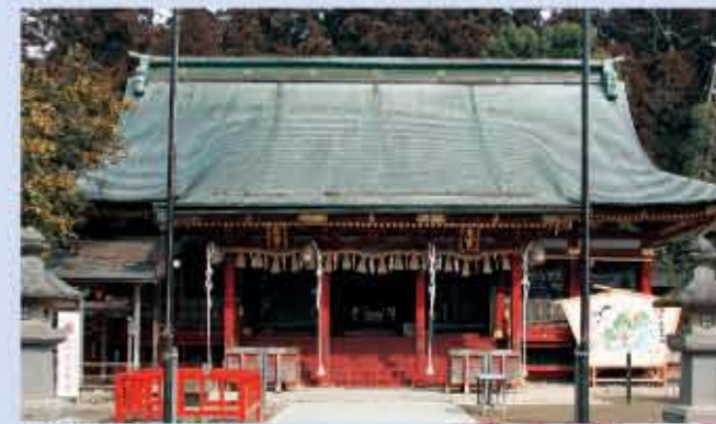
시오가마 신사 【지도 E-3】 ● 시오가마시 아베코리야마 1-1 ☎ 022-367-1611 ● 경내 오전 5시~오후 8시 ▼ 환대무도

도호쿠 지방 전역-오슈 지역의 신사로 1200년 이상의 역사를 자랑하며 옛날부터 풍이거린 해상문화, 만경의 신으로서 신앙을 받고 있습니다. 본령이나 배편 들은 국가 중요문화재로 지정되어 있습니다. 한편, 같은 지역모리야마 지역에 모셔져 있는 시와히코 신사는 시오가마 신사와는 분위기가 사뭇 달라 본령은 검은 울림-배편은 주홍 울림의 극대개 신전입니다. 경내에서는 머쓰시마 환의 설화를 열망할 수 있습니다.