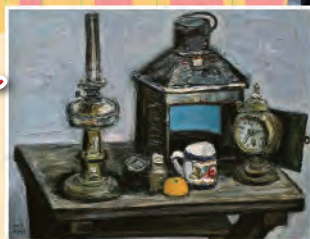
《青いランプの静物》1969年 仙台市所蔵