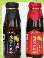
利府町 利府梨を使った 焼肉のたれ