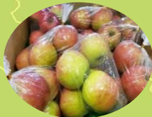
大衡村 りんごなど