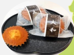
大和町 マドレーヌ