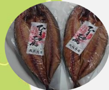
塩竈市 さばの一夜干し