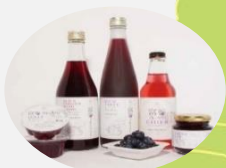
富谷市 ブルーベリージュース他