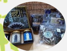
七ヶ浜 海産物セット