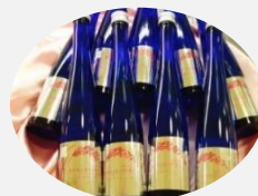
多賀城市 おもわく姫