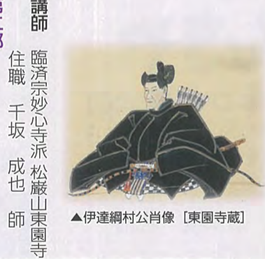
▲伊達綱村公肖像【東園寺蔵】